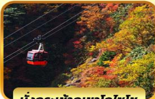
นั่งกระเช้าภูเขาโทไซไซ