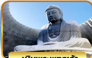
เป็นพระพุทธรเจ้า

05-10, 12-17, 19-24 พ.ย. 26 พ.ย. - 01 ธ.ค. 67