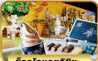
ช็อกโกแลตอิชียะ