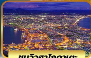
ชมวิวดาฮอกไกดาเตะ