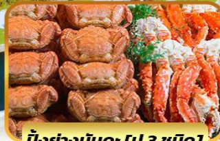
บั้งย่างมันตะ [ปู 3 ชนิด]