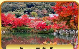
วัดเออิทังโตะ