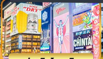
ย่านชินโซบาชิ