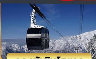
กระเช้าชินโอดากะ