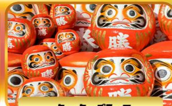
วัดคัตสึโงจิ