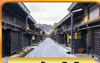
ถนนชินมาชิซุจิ