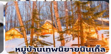
หมู่บ้านเทพนิยายน้ำแข็ง

THAI สายการบินไทย บริการทุกระดับประทับใจ FULL SERVICE