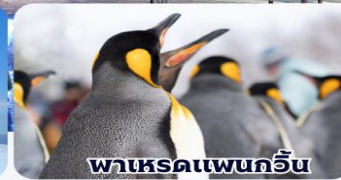
พาเหรดเพนกวิน