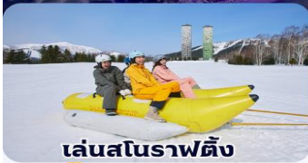
เล่นสโนว์ราฟติง