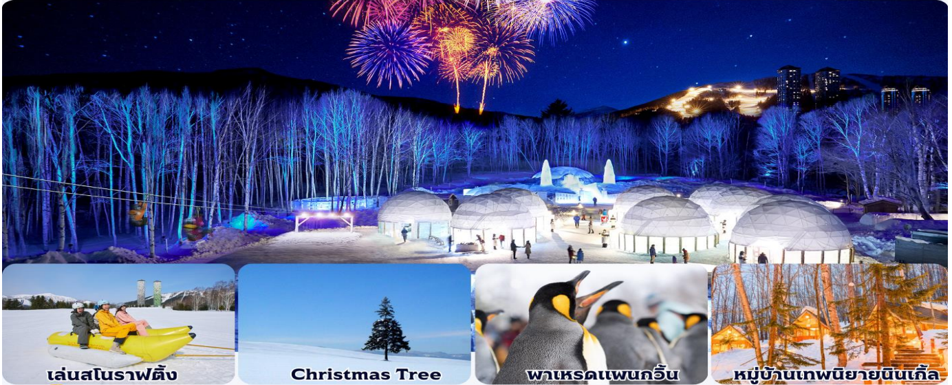
เล่นสโนว์ราฟติง

📍 ซัปโปโร-โอดารุ-บิเะ-อาซาฮิยาม่า-โซอุเนเคียว