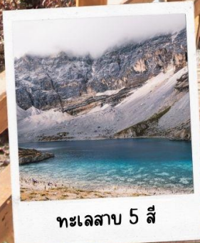
ทะเลสาบ 5 สี