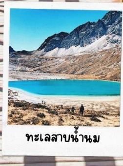
ทะเลสาบน้ำนม