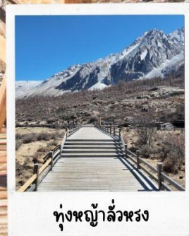
ทุ่งหญ้าสีม่วง