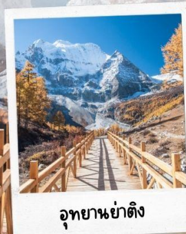
อุทยานยาดิง