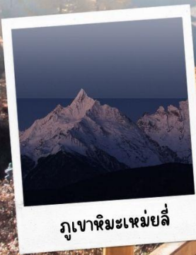
ภูเขาหิมะเหม่ยลี่