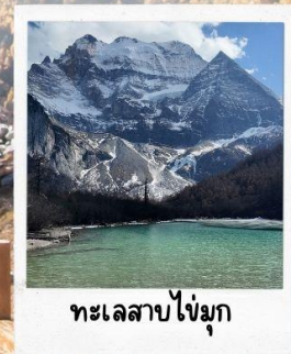
ทะเลสาบไข่มุก