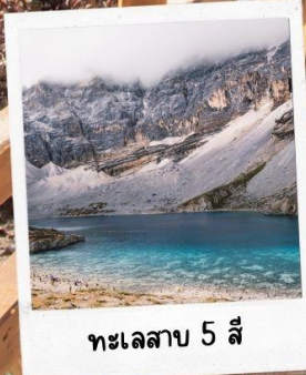
ทะเลสาบ 5 สี