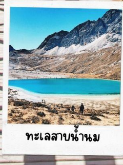
ทะเลสาบน้ำนม