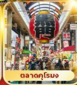
ตลาดคุโรมง