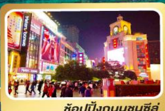
ช้อปปิ้งถนนชุนซีลู่