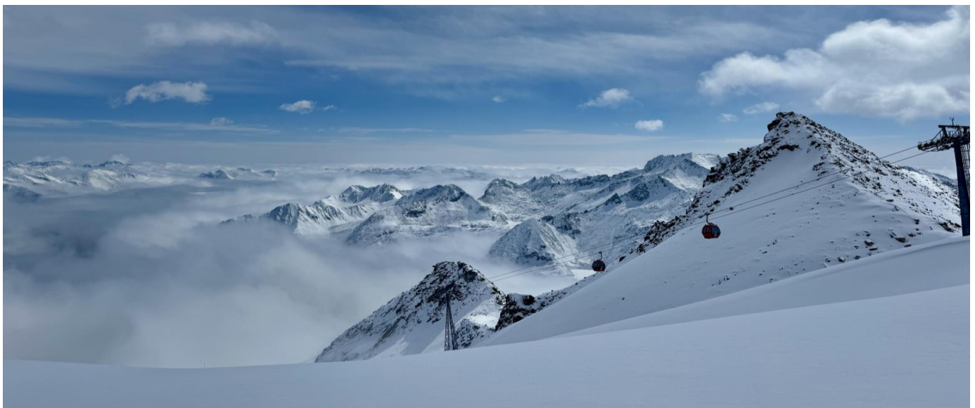
GO1TFU-TG011 เฉิงตู ภูเขาหิมะกลาเซียร์ต้ากู่ปังชว่น โหมวหนี่โกว จิวจ้ายโกว(นั่งรถไฟความเร็วสูง) 6วัน 5คืน *ไม่ลงร้านช้อปปิ้ง/รวมรถเหมา* โดยสายการบิน Thai Airway (TG)

เช้า รับประทานอาหารเช้า ณ ห้องอาหารภายในโรงแรม (มื้อที่ 2)