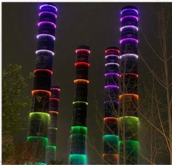
ชมแสงสีห้าง SKP