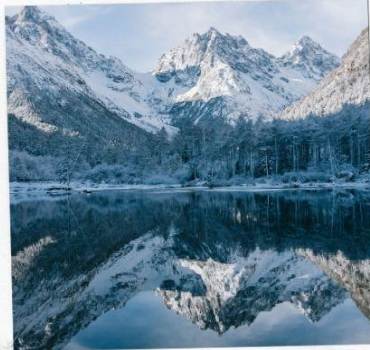
อุทยานปีเพิงโกว