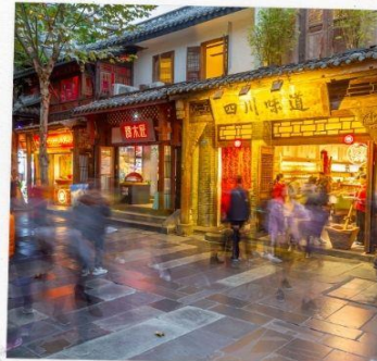
ถนนชอยกว้างแคบ