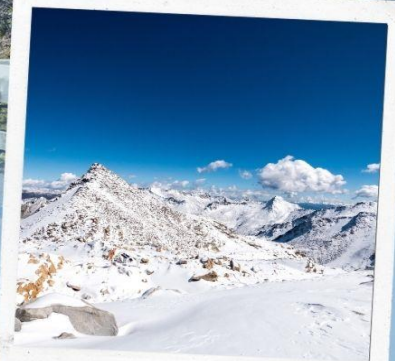
ภูเขาหิมะการ์เซีย ต่ากู่ปิงชวน