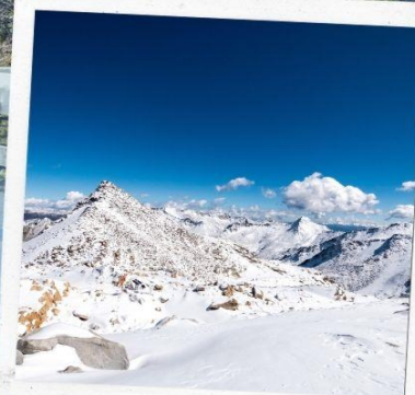
ภูเขาหิมะการ์เซีย ท่ากู่ปิงชว่น