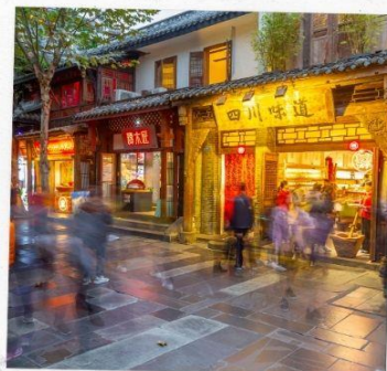
ถนนชอยกว้างแคบ