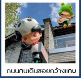
ถนนคนเดินชอยกวางแคบ