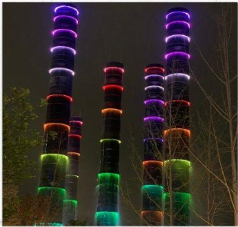
ชมแสงสีห้าง SKP