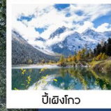
ปี้ผิงโกว

อุทยานภูเขาสิ่วตง / หุบเขาซวงเจียวโกว / อุทยานภูเขาสิ่วตง อุทยานปี้ผิงโกว / ภูเขาหิมะการ์เซียต้ากู่ปิงชว่น / วัดต้าฉือ ถนนคนเดินซุนซีลู่ / ชมแสงสียามค่ำที่ลานห้างสรรพสินค้า SKP ถนนคนเดินชอยกวางแคบ / POP MART