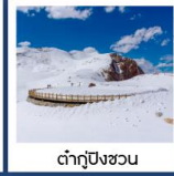
ต้ากู่ปิงชว่น