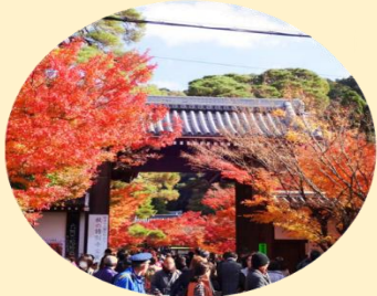
จุดประตูไซมง เป็นประตูทางเข้าหลักของวัดเอคันโด

นำท่านเยี่ยมชม วัดเอคันโด หรือที่รู้จักกันอีก 3 ชื่อ อาทิ เซนรินจิ โชจูโรงะซัง และมุเรียวจูอิน วัดแห่งนี้ตั้งอยู่ทางฝั่งใต้ของ ทางเดินนักปราชญ์ (Philosopher's Path) ตรงใจกลางเมืองอิงาชิยามะ พื้นที่ตรงนี้กว้างใหญ่โดยมีอาคารมากมายที่เชื่อมถึงกันด้วยทางเดินแบบมีหลังคาคลุม วัดแห่งนี้คือของขวัญที่ขุนนางตุลาการในสมัยเออัน (ปี 794-1185) มอบให้พระสงฆ์ ภายในวัดเต็มไปด้วยงานศิลปะหลากหลายชิ้น โดยชิ้นที่มีชื่อเสียงที่สุดคือรูปปั้นพระอมิตาพุทธ ซึ่งพระเศียรหันไปด้านหนึ่งแทนที่จะมองตรงมาทางด้านหน้าอย่างที่เห็นกันตามปกติ ตำนานเล่าไว้ว่าขณะที่เจ้าอาวาสประกอบพิธีสำหรับพระพุทธรูปองค์นี้ ท่านได้เห็นมามองและพูดคุยกับเจ้าอาวาส อีกทั้งยังเป็นวัดที่รู้จักกันดีว่ามีใบไม้ที่สวยงามมีชื่อเสียงในการชมใบไม้เปลี่ยนสีในช่วงฤดูใบร่วงตอนประมาณปลายเดือนพฤศจิกายนถึงต้นเดือนธันวาคม โดยจะงดงามมากขึ้นไปอีกจากแสงที่มาจากกระทะบิยามเย็น ภายในวัดมีมุมถ่ายรูปกับใบไม้เปลี่ยนสีมากมาย อาทิ