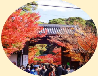
จุดประตูซังมง เป็นประตูทางเข้าหลักของวัดเอคันโด

นำท่านเยี่ยมชม วัดเอคันโด หรือที่รู้จักกันอีก 3 ชื่อ อาทิ เซนรินจิ โชจูโรโจซัง และมุเรียวจูอิน วัดแห่งนี้ตั้งอยู่ทางฝั่งใต้ของ ทางเดินนักปราชญ์ (Philosopher's Path) ตรงใจกลางเมืองอิงาชิยามะ พื้นที่ตรงนี้กว้างใหญ่โดยมีอาคารมากมายที่เชื่อมถึงกันด้วยทางเดินแบบมีหลังคาคลุม วัดแห่งนี้คือของขวัญที่ขุนนางตุลาการในสมัยเออัน (ปี 794-1185) มอบให้พระสงฆ์ ภายในวัดเต็มไปด้วยงานศิลปะหลากหลายชิ้น โดยชิ้นที่มีชื่อเสียงที่สุดคือรูปปั้นพระอมิตาพุทธ ซึ่งพระเศียรหันไปด้านหนึ่งแทนที่จะมองตรงมาทางด้านหน้าอย่างที่เห็นกันตามปกติ ตำนานเล่าไว้ว่าขณะที่เจ้าอาวาสประกอบพิธีสำหรับพระพุทธรูปองค์นี้ ท่านได้หันมามองและพูดคุยกับเจ้าอาวาส อีกทั้งยังเป็นวัดที่รู้จักกันดีว่ามีใบไม้ที่สวยงามมีชื่อเสียงในการชมใบไม้เปลี่ยนสีในช่วงฤดูใบร่วงตอนประมาณปลายเดือนพฤศจิกายนถึงต้นเดือนธันวาคม โดยจะงดงามมากขึ้นไปอีกจากแสงที่มาจากกระทะบิยามเย็น ภายในวัดมีมุมถ่ายรูปกับใบไม้เปลี่ยนสีมากมาย อาทิ