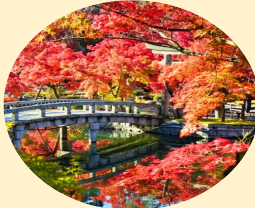
จุดร้านน้ำชา และหนทสึบุน ทำให้ภาพบรรยากาศที่งดงามของลานแห่งนี้สีแดง ที่ปกคลุมไปด้วยใบไม้เปลี่ยนสี

บ่อน้ำที่อยู่ใจกลางวัด มีสะพานข้ามมายังศาลเจ้าถือเป็นจุดถ่ายภาพยอดนิยม