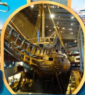
พิพิธภัณฑ์เรือวาซา