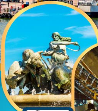
น้ำพุแห่ง ราชินีเกรทฟีออน