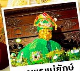
ขอฟรแม่ยักย์