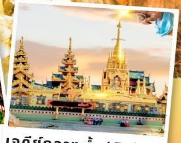
เจดีย์กลางน้ำ (สิริเรียม)