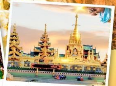
เจดีย์กลางน้ำ (สิริเรียม)