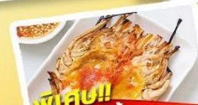
พิเศษ!! กุงแม่น้ำ + HOTPOT SEAFOOD