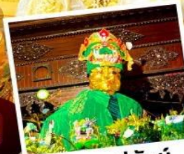
ขอพรแม่ยักย์