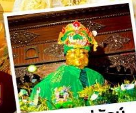
ขอฟรแม่ยักย์