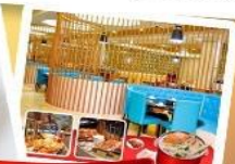
ก๊วยแม่น้ำ + HOTPOT SEAFOOD