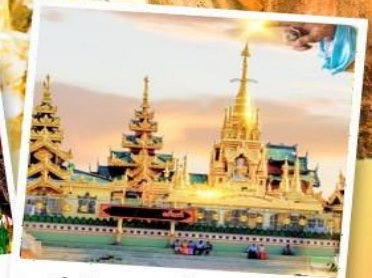
เจดีย์กลางน้ำ (สิริเรียม)