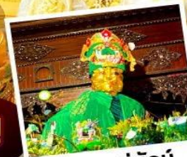
ซอพรแม่ยักย์