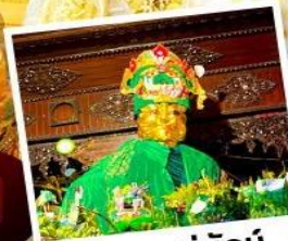
ขอพรแม่ยักย์