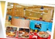
ก๊อแม่่น้ำ + HOTPOT SEAFOOD