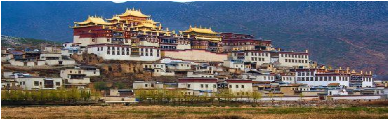
GO1CNXKMG-MU007 บินตรงเชียงใหม่ สัมผัส..เสน่ห์ คุนหมิง แฉงกรีลา ย่าติง ปาลาเก๋องจ (นั่งรถไฟความเร็วสูง) ไม่ลงร้าน 6 วัน 5 คืน (MU)

จากนั้นนำท่านเที่ยวชม วัดลามะชงจ้านหลิน ตั้งอยู่บริเวณตีนเขาฝอปังห่างจากเมืองจงเตียนไปทางเหนือ 4 กิโลเมตรสร้างขึ้นในปีค.ศ. 1679 เป็นวัดลามะที่มีอายุเก่าแก่กว่า 300 ปีมีพระลามะจำพรรษาอยู่กว่า 700 รูปสร้างขึ้นในสมัยการปกครองของตะไลลามะองค์ที่ 5 ซึ่งใกล้เคียงกับสมัยอยุธยาตอนต้นในช่วงศตวรรษที่ 17 สมัยจักรพรรดิคังซีแห่งราชวงศ์ชิงได้มีการซ่อมแซมต่อเติมอีกหลายครั้งโครงสร้างของวัดแห่งนี้สร้างตามแบบพระราชวังโปตาลาในเมืองลาซา(ทิเบต) ที่มีหอประชุมหลัก 2 หอและโอบล้อมไปด้วยห้องพักสำหรับพระกว่า 100 ห้องนอกจากนี้ยังมีโบราณวัตถุอีกมากมายรวมทั้งรูปปั้นทองสัมฤทธิ์ที่มีชื่อเสียงมากที่สุดเดินทางต่อสู่เมืองลี่เจียงเป็นเมืองที่ตั้งอยู่ในหุบเขาที่มีทัศนียภาพงดงามเป็นถิ่นที่อยู่ของชาวนาซีถือเป็นชนกลุ่มน้อยที่มีความน่าสนใจทั้งทางขนบธรรมเนียมและวัฒนธรรมเช่นการมีโครงสร้างทางสังคมแบบสตรีเป็นใหญ่ นอกจากนั้นยังมีภาษาภาพที่เป็นเอกลักษณ์อีกด้วย