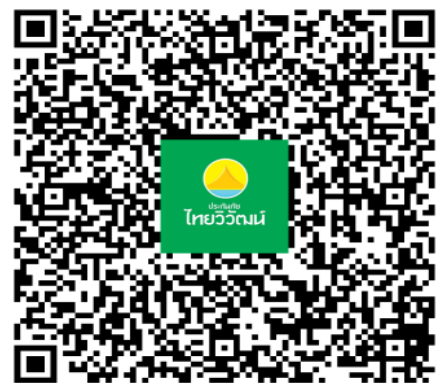
รายละเอียดกรมธรรม์ไทยวิวัฒน์

GO1HRB-CA005- ฮาร์บิน สโนว์ทาวน์ เทพนิยายแดนหิมะ 7 วัน 5 คืน โดยการบิน แอร์ไชน่า (CA)