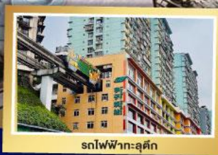
รถไฟฟ้า-ฉุดัก