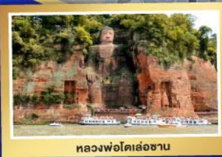
หลวงฟอโตเล่อซาน