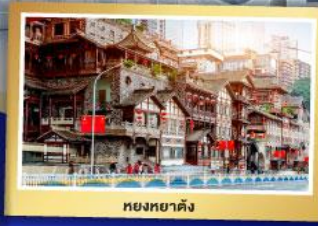
หยงหยาดัง