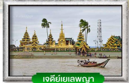
เจดีย์หยก