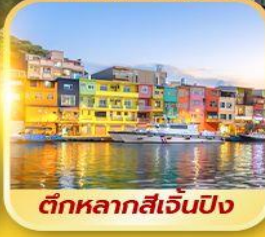
ตึกหลากสี่เจินปิง