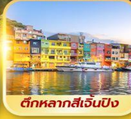
ตึกหลากสี่เจินปิง