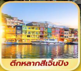
ตึกหลากสี่เจิ้นปิง