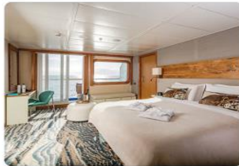
Balcony Suite Plus & Balcony Suite