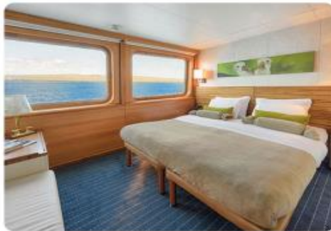
Junior Suite Plus & Junior Suite