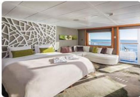
Legend Balcony Suite