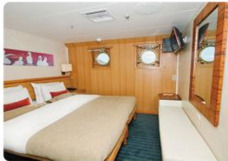
Junior Suite Plus & Junior Suite