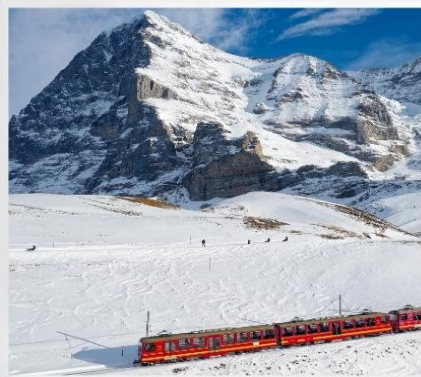
ขึ้นรถไฟสู่ยอดเขา “จุงเฟรา” TOP OF EUROUP