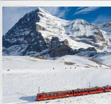
ขึ้นรถไฟสู่ยอดเขา “จุงเฟรา” TOP OF EUROUP