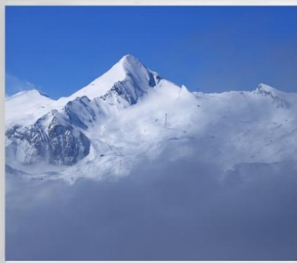
ขึ้นกระเช้าสู่ยอดเขา “คิทซ์ส์ไตน์ฮอร์น” TOP OF SALZBURG