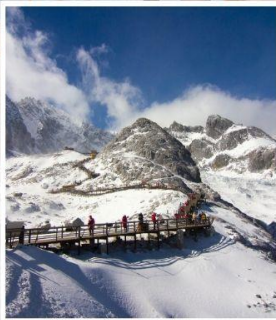
ภูเขาศิมะมังกรหยก