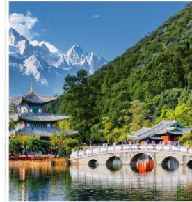
สะพาน้ำมังกรดำ