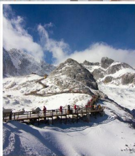
ภูเขาศิมะมังกรหยก