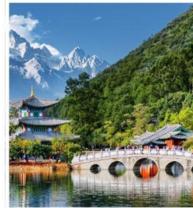
สะพาน้ำมังกรดำ