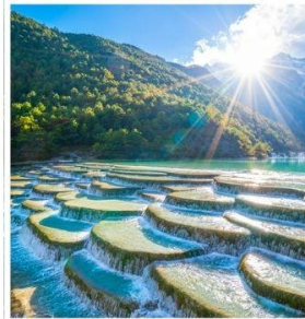
หุบเขาพระจันทร์ สีน้ำเงิน