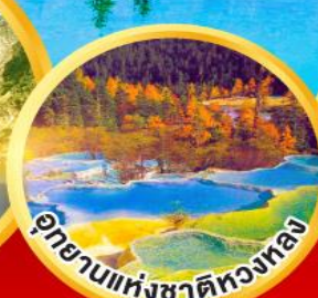
อุทยานแห่งชาติหลงหลง