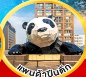
แพนด้าปิงตึก