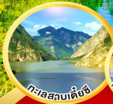
ทะเลสาบเต๋ยซี