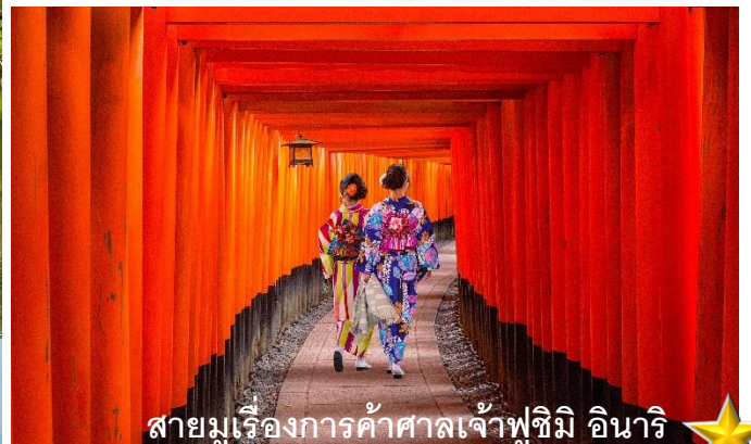
สายมูเรื่องการค้าศาลเจ้าฟูชิมิ อินาริ