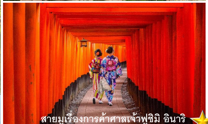
สายมูเรื่องการค้าศาลเจ้าฟูชิมิ อินาริ