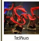
ไชว์ทึเบต