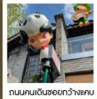
ถนนคนเดินชองกว้างแคบ