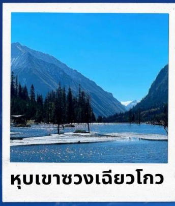
หุบเขาซวงเจียวโกว