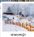
ภูเขาหิมะ