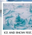
ICE AND SNOW FEST.