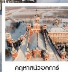
ฤดูหนาวออกคาร์