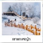
เขากะหล่ำ