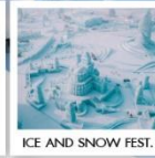
ICE AND SNOW FEST.