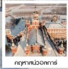
ฤดูหนาววอลกิ้ง