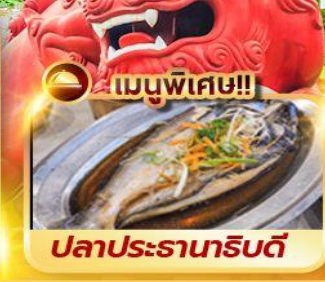
เมนูพิเศษ!! ปลาประธาธิบดี