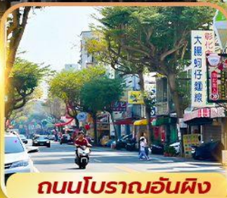
ถนนโบราณอันผิง