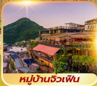
หมู่บ้านจิวเฟิน