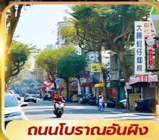
ถนนโบราณอันผิง