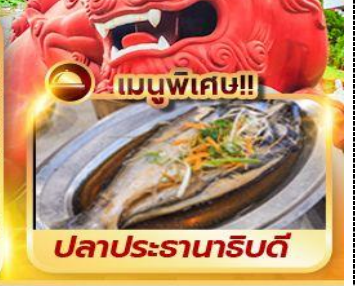
เมนูพิเศษ!!