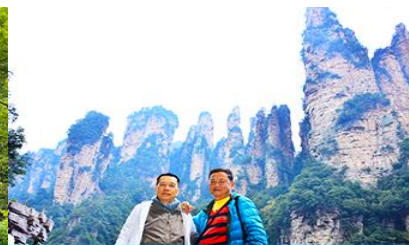
ชมจุดชมวิวลีฟู่กั๋ว