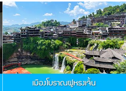
เมืองโบราณฝูเหรวเจิ้น