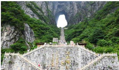
ประตูลูกศร