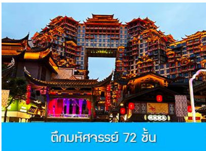
ตึกมหิศวรรษย์ 72 ชั้น

พักที่ CHANGDE YUNXI HOTEL ระดับ 4 ดาวท้องถิ่น หรือเทียบเท่าในเมืองฉางเต๋อ