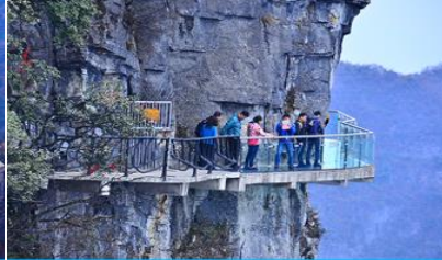
หน้าผาลอยฟ้าทางเดินกระจก