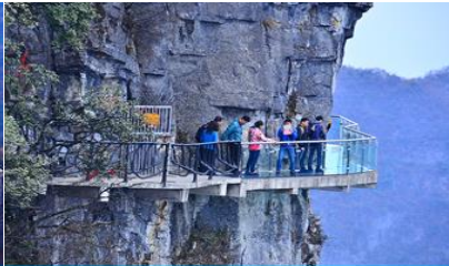
หน้าพลาวยฟ้าทางเดินกระจก