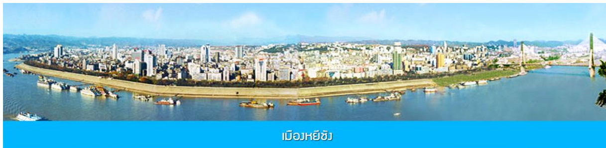
เมืองหยีชัง