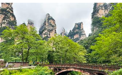
จุดชมวิวจินเปียนฮั