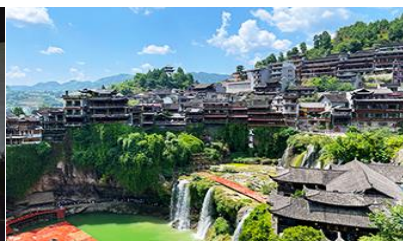
เมืองโบราณฝูเหรวเจิ้น