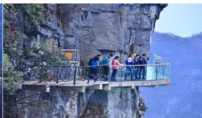
หน้าพลาวยฟ้าทางเดินกระจก