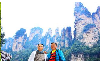
ชมจุดชมวิวลีฟท์แก๊ว