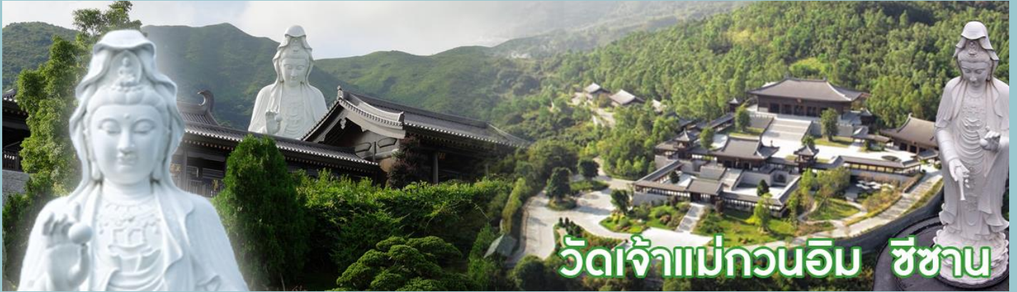
วัดเจ้าแม่กวนอิม ชีซาน

วัดชีซาน หลายคนที่เคยไปเที่ยวฮ่องกงมาแล้ว อาจจะยังไม่เคยเยือนวัดชีซาน หรือ Tsz Shan Monastery เป็นวัดที่มีเจ้าแม่กวนอิมองค์ใหญ่เป็นอันดับสองของโลก มีความสูงถึง 76 เมตร ตั้งอยู่บนเนื้อที่กว่า 29 ไร่ ในเกาะฮ่องกง โดยมีนายลีกาซิง มหาเศรษฐีชื่อดังของฮ่องกง บริจาคเงินสร้างวัดนี้ถึง 193 ล้าน ดอลลาร์เลยทีเดียว