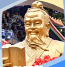
หวังต้าเซียง