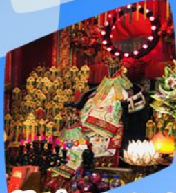
เจ้าแม่กวนอิมซิมเงิน