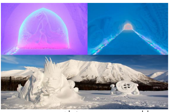
รูปปั้น โปสท์ อุโมงค์

นำท่านเดินทางสู่ “เมืองคีรอฟท์” (KIROVSK) ซึ่งตั้งอยู่ทางตอนใต้ของเมืองมูร์มันส์ค์ ล้อมรอบด้วยภูเขาเป็นสถานที่หนาวเย็น ก่อตั้งขึ้นในช่วงหลังจากที่มีการค้นพบแร่ธาตุในดินและอุตสาหกรรมเหมืองแร่ (ใช้เวลาในการเดินทาง 2 ชั่วโมง 50 นาที) เข้าชม “เมืองหิมะ” (SNOW VILLAGE) อาคารที่มีเอกลักษณ์เฉพาะตัวโดยสร้างขึ้นจากหิมะและน้ำแข็งทั้งหมด ในทุกเดือนพฤศจิกายนของทุกปี นักแกะสลักน้ำแข็งจากทั่วทุกภูมิภาคจะเดินทางมาเมืองคีรอฟท์ เพื่อออกแบบห้องโถงและอุโมงค์ที่เต็มไปด้วยหิมะ และที่นี่มีการแกะสลักบนผนังที่สวยงามและประติมากรรมน้ำแข็งเป็นรูปต่างๆที่มีแสงสีสวยงาม อาทิ รูปปั้น โปสท์ อุโมงค์