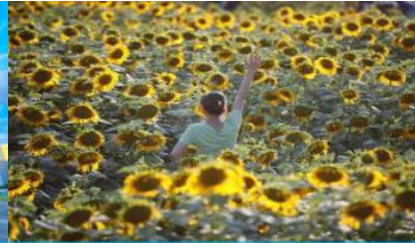
ดอกทานตะวันในสวนโอลิมปิก