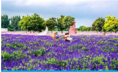
ทุ่งดอกลาเวนเดอร์