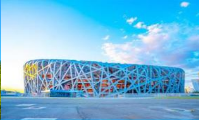
สนามกีฬาโอลิมปิก