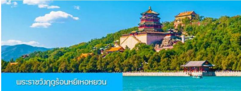
พระราชวังฤดูร้อนหยี่เหอหยวน