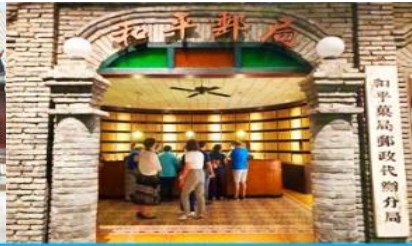
เมืองโบราณจำลอง