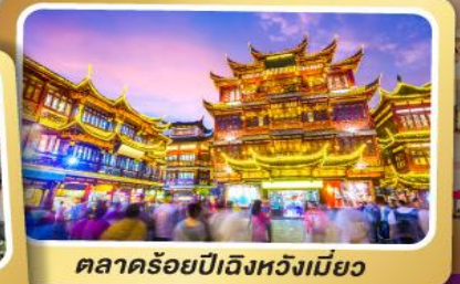
ตลาดร้อยปีเจียงหวงเหมียว

สนุกสุดมันส์ไปกับเครื่องเล่น Shanghai Disneyland เต็มวัน