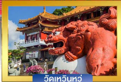
วัดเหวินหัว